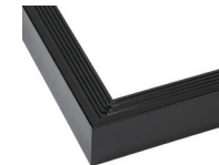
Aluminium daktrim (zwart of zilver)